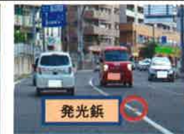
The Luminous rivets.