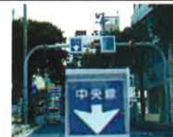
The sign of the Center line.

Okinawa Prefectural Police HQ (Main switchboard) 098-862-0110